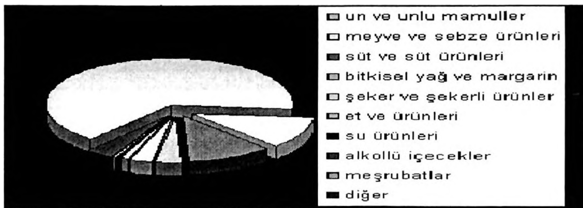
Şekil 1. Türkiye gıda sektörünün alt sektörler itibariyle dağılımı

2005 yılı verileri göz önüne alındığında, ülkemizdeki gıda sektörünün alt sektörler itibariyle dağılımı aşağıdaki gibidir (Anonim, 2005a).